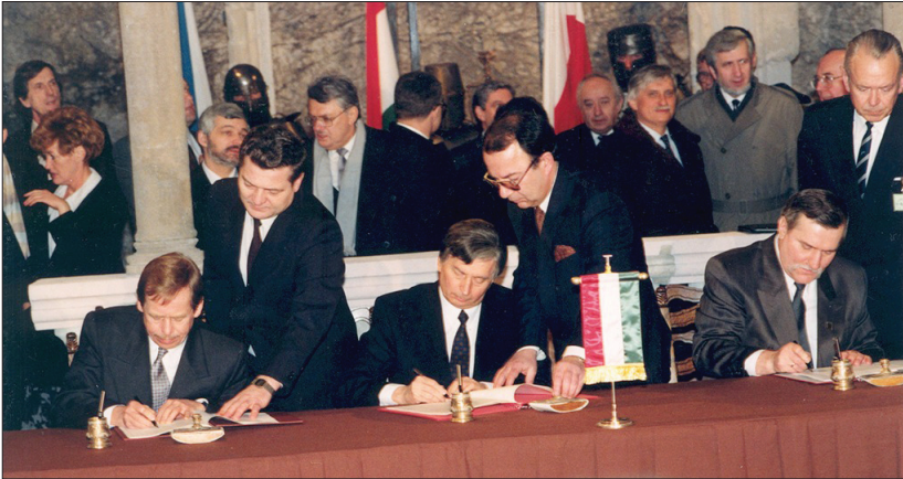
Підписання Вишеградської декларації 15 лютого 1991 року в трьох однакових оригіналах польською, чеською й угорською мовами

15 лютого 1991 року в угорському місті Вишеград 2 під час зустрічі Президента Чехословацької Республіки Вацлава Гавела, Президента Республіки Польща Леха Валенси та Прем'єр-міністра Угорської Республіки Йозефа Антала була ухвалена Вишеградська декларація про співробітництво між Чеської та Словацькою Федеративною Республікою, Республікою Польща та Угорською Республікою в прагненні до європейської інтеграції. Під час зустрічі було створено історичну арку, яка пов'язувала ідею цієї зустрічі з ідеєю подібної зустрічі, що відбулася там 1335 року.